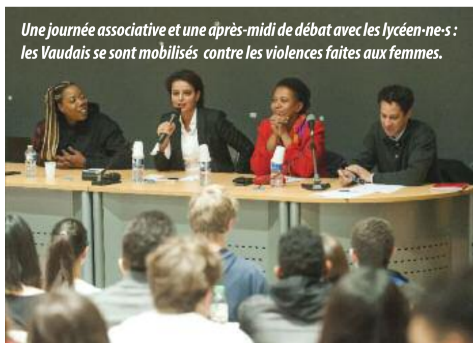
Une journée associative et une après-midi de débat avec les lycéen-ne-s : les Vaudais se sont mobilisés contre les violences faites aux femmes.

lundi 26 novembre, aux côtés de la maire Hélène Geoffroy et de l'ancienne ministre de l'Éducation nationale et des Droits des femmes, Najat Vallaud-Belkacem. Sans filtre, elles ont parlé des violences intra-familiales et conjugales, des mariages forcés, de harcèlement, de la traite des êtres humains et des mutilations génitales avec les lycéens et les lycéennes, lors d'un débat animé par Karim Mahmoud-Vintam de l'association Les Cités d'or, qui a rappelé, en préambule, que 123 femmes ont été tuées par leurs partenaires ou ex-partenaires en 2016.