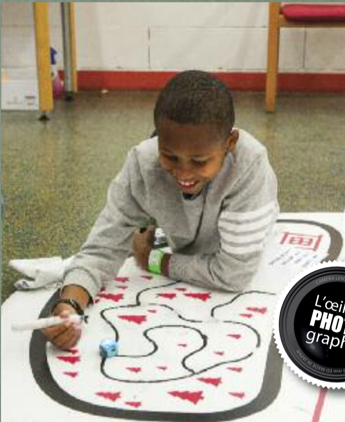
Tous numériques - bibliothèque Percé - samedi 17 novembre

Pour la sixième année, les Gazelles se relayent tous les jours, de 10 à 20 heures, jusqu'au 24 décembre, pour emballer les cadeaux à la librairie Gibert-Joseph du Carré de Soie. Objectif : récolter de l'argent pour partir en voyage !