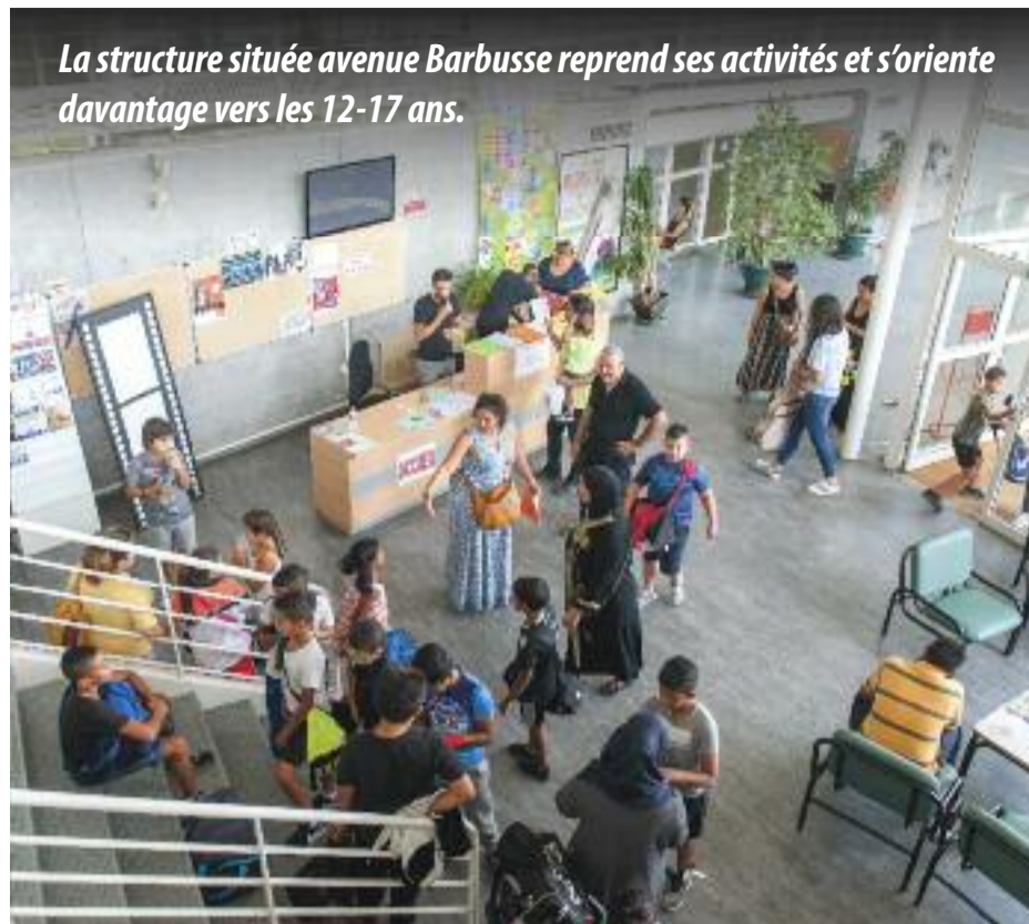
La structure située avenue Barbusse reprend ses activités et s'oriente davantage vers les 12-17 ans.

Pratique : MJC, 13 avenue Henri-Barbusse, Tél, 04 72 04 13 89. mjc-vaulxenvelin.com