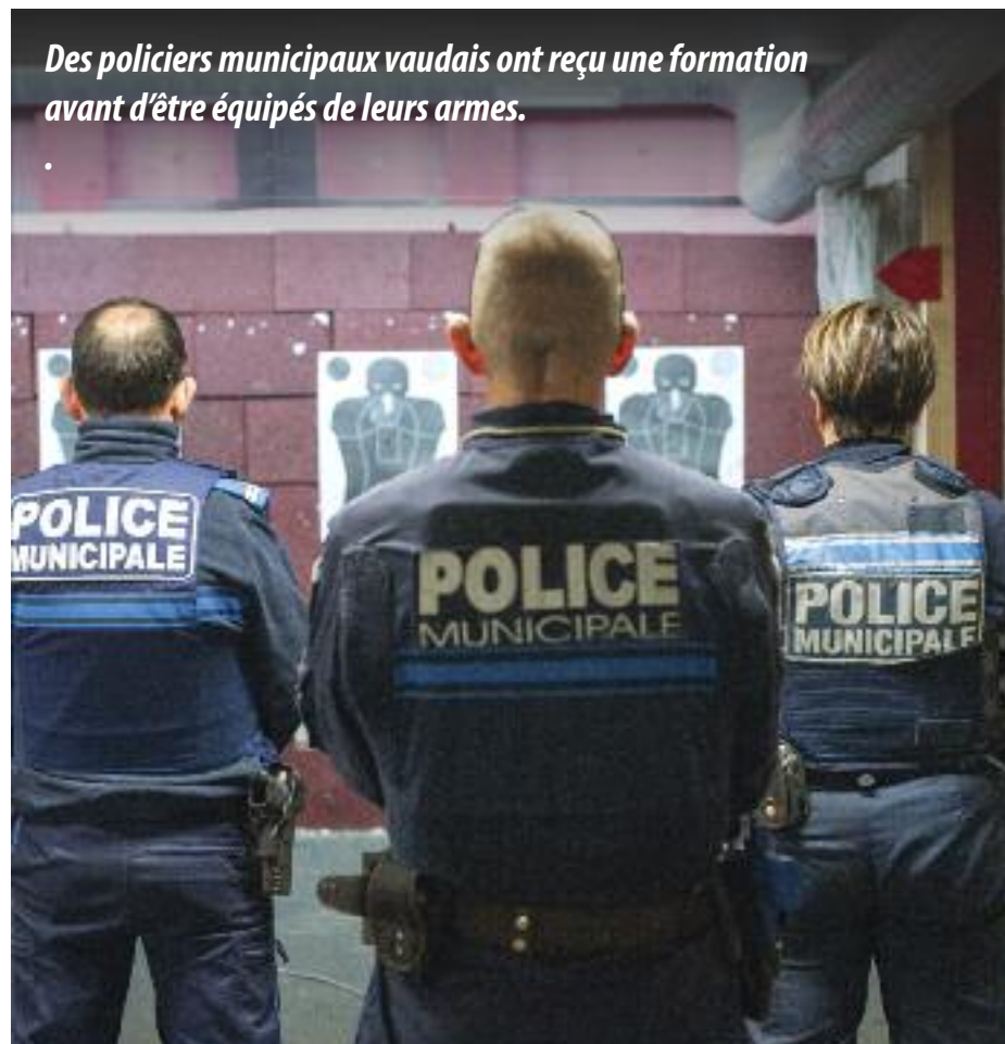
Des policiers municipaux vaudais ont reçu une formation avant d'être équipés de leurs armes.