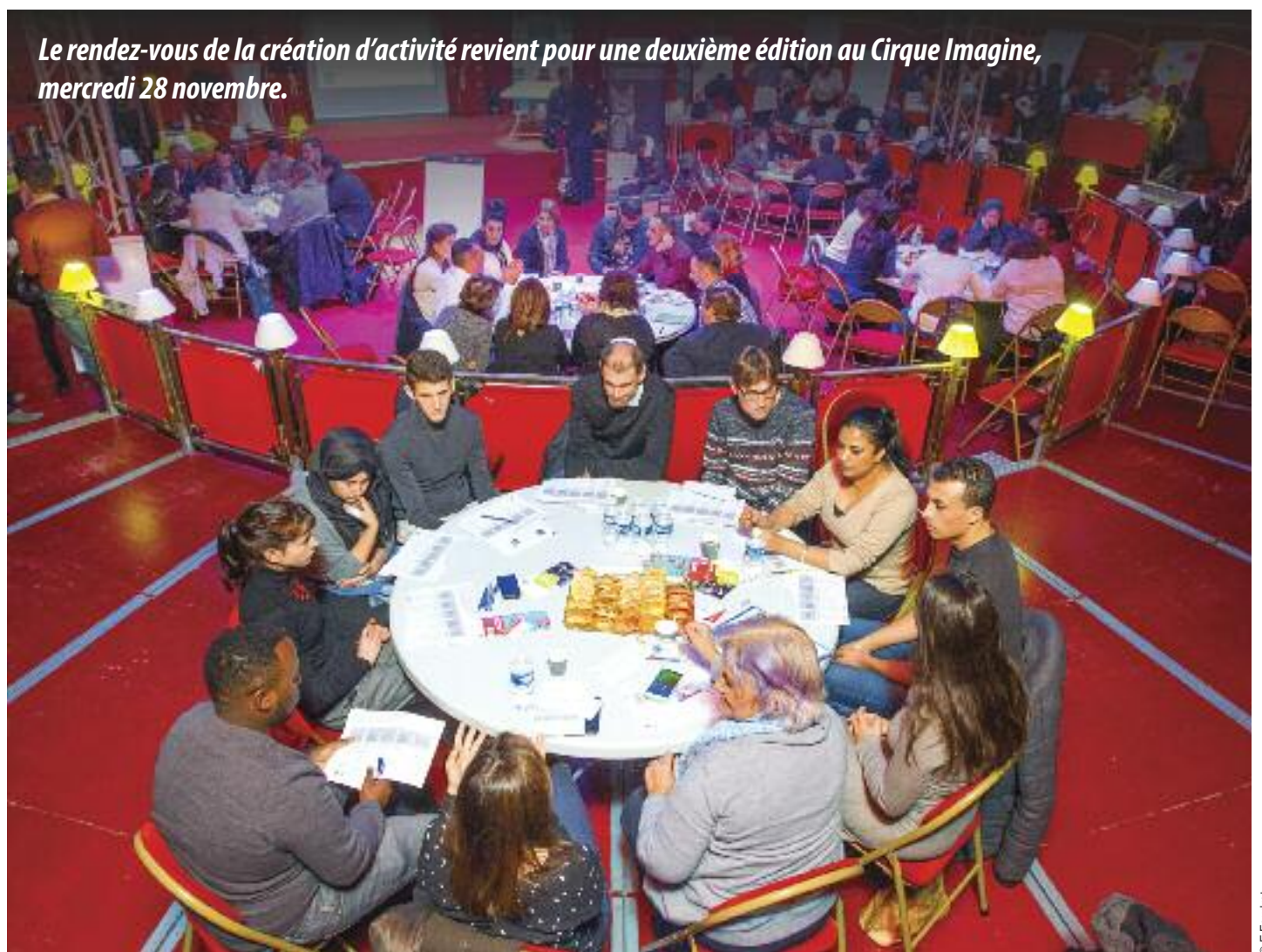
Le rendez-vous de la création d'activité revient pour une deuxième édition au Cirque Imagine, mercredi 28 novembre.

Mercredi 28 novembre, de 9h30 à 11h30, se dérouleront en effet simultanément quatre tables rondes, réunissant chacune dix personnes, qui aborderont durant une heure les différentes étapes qui attendent tout néo-entrepreneur : clarifier son idée, structurer son projet, le financer, développer son réseau... Par rapport à l'an dernier, ces ateliers seront donc plus généralistes et moins thématiques autour d'un secteur économique particulier. Ils seront suivis, de 11h50 à 12h10, d'un concours de pitches : trois candidats, qui projettent de monter leur activité ou qui l'ont lancée il y a moins de six mois, devront la présenter en deux minutes chrono à un jury composé de quatre représentants de la Chambre de commerce et d'industrie (CCI) Lyon Métropole, de la Chambre de métiers et de l'artisanat (CMA) du Rhône et de la Métropole de Lyon, de l'association Vaulx-en-Velin Entreprises (VVE) et de la Ville. Au préalable, ils auront été sélectionnés parmi