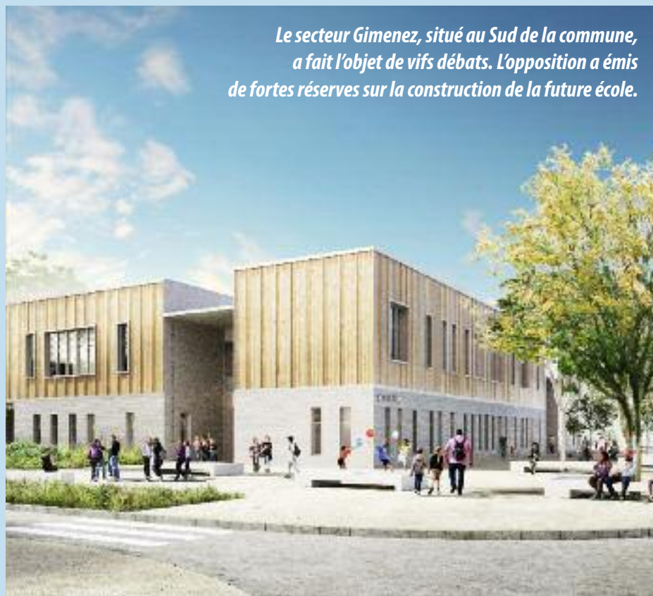
Le secteur Gimenez, situé au Sud de la commune, a fait l'objet de vifs débats. L'opposition a émis de fortes réserves sur la construction de la future école.